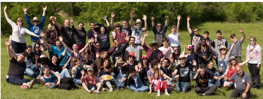
© La Parole est dans le pré