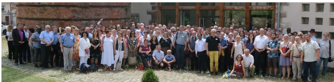
Souvenirs : pastorale 2018

Une pastorale pour quoi faire ? Une rencontre pour se retrouver, se ressourcer, échanger et partager. Nous avons hâte de vous revoir.