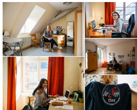
Le foyer des étudiants du Stift

Pour les paroisses qui souhaitent collecter des dons en ligne, nous vous rappelons qu'une plateforme de dons en ligne est à votre disposition. Pour tout renseignement, contactez le service financier : service-financier@uepal.fr