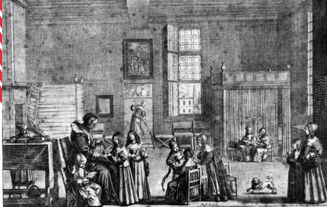
Abraham Bosse : « La maistresse d'escole »

Luther, n'en oublie pas moins les filles. Dès 1524, ils lancent un appel résolu pour demander que l'on crée des écoles pour les Strasbourgeoises et proposent des mesures concrètes. De fait, les établissements scolaires féminins se développent et changent la vie de nombreuses fillettes, en particulier de celles issues de milieux modestes qui, sans cela, n'auraient jamais eu accès à la lecture et à l'écriture.