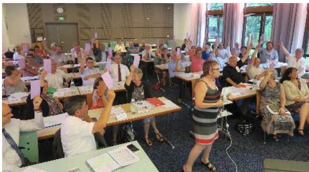
Vote à l'unanimité à l'Assemblée de l'Union