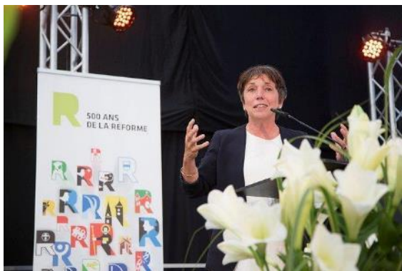
Margot Kässmann