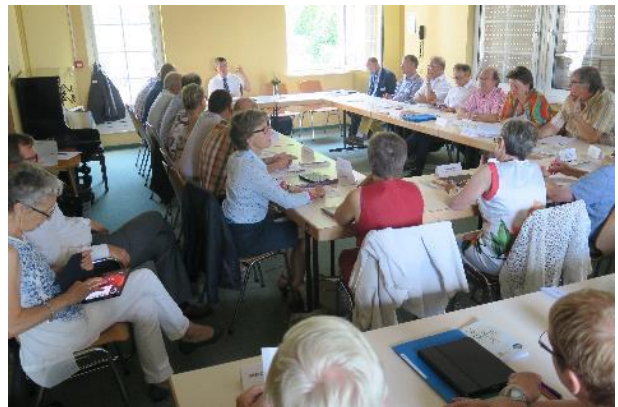
Le Consistoire supérieur