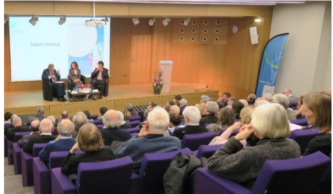
Un auditoire attentif

Le même soir a également été diffusé le flyer « Politique : tous concernés, tous responsables » réalisé par la CASPE dans la série « Ce que nous croyons ».