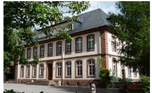
Le Château des EUL à Neuwiller-les-Saverne