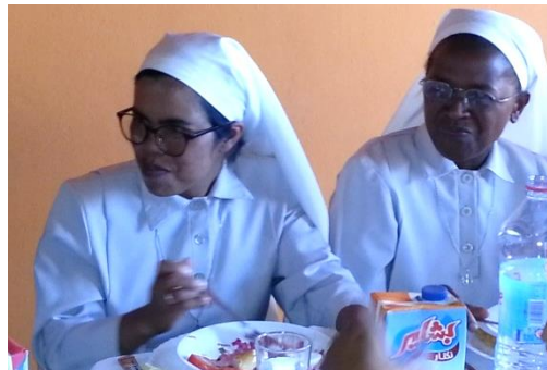
Sœurs Pélagie et Berthine

Envie de les rencontrer ? Contactez-nous : service Mission, 03 88 25 90 30 / mission@uepal.fr