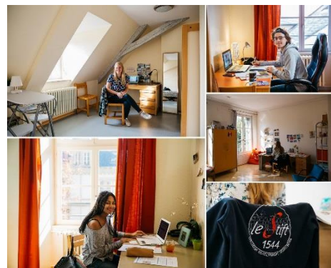
Le foyer étudiants du Stift

Offrande à verser à l'ESP. Merci pour votre soutien.